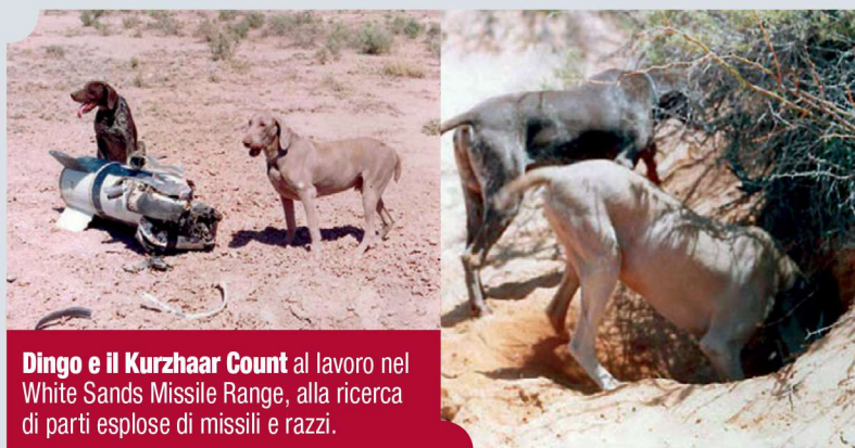
Dingo e il Kurzhaar Count al lavoro nel White Sands Missile Range, alla ricerca di parti esplose di missili e razzi.