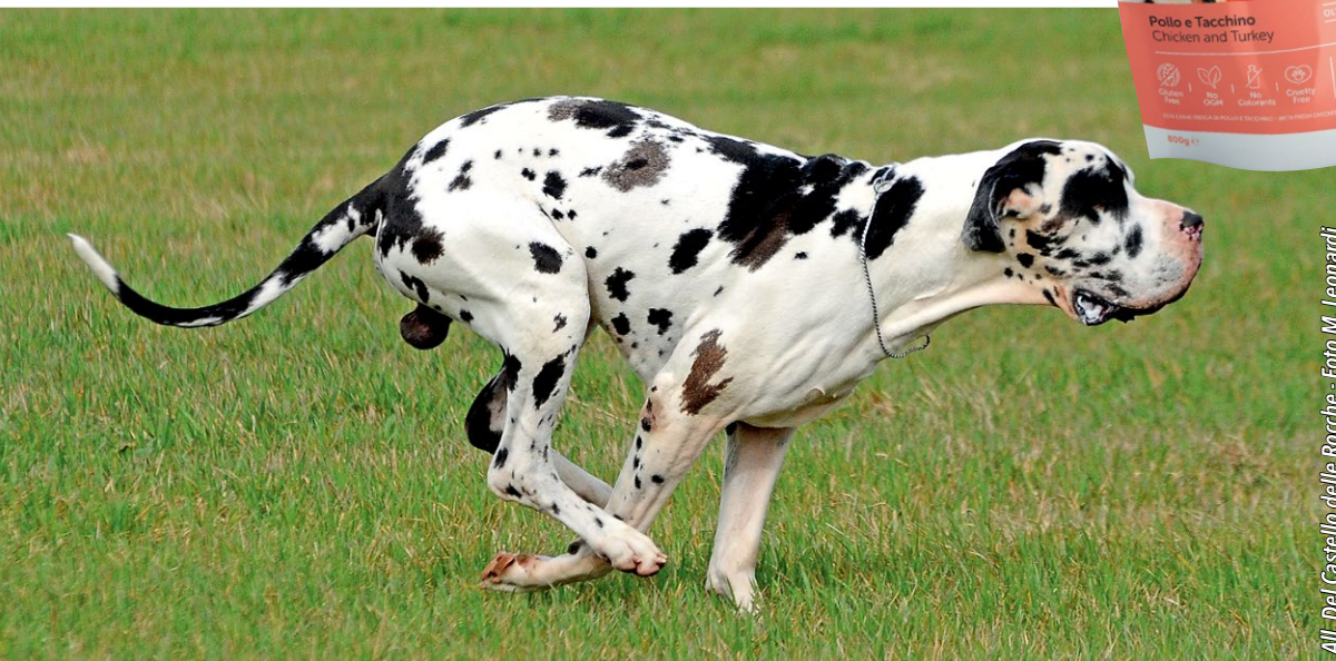
All: Del Castello delle Rocche

può passare, gradualmente e in ragione di due pasti al giorno, a Italian Way pollo e riso Classic Fit Adult maxi di Giuntini che, con la sua formula gluten free, è adatta anche ai soggetti più inclini a sviluppare allergie alimentari e mantiene un elevato tenore proteico grazie alle elevate inclusioni di carne. Tutta la linea Italian Way è inoltre priva di OGM e senza coloranti, ed è arricchita con la "ricetta della vita": una speciale formula brevettata che aiuta a prevenire l'attacco da parte di flebotomi e culicidi, insetti portatori di malattie.